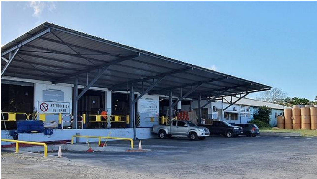
Produktionsstandort Société Guadeloupéenne de Carton Ondulé

Die Klingele Paper & Packaging Group mit Sitz in D-Remshalden, ein Hersteller von Wellpappenrohpapieren und Verpackungen aus Wellpappe, hat von der International Paper Company, einem weltweit tätigen Hersteller von Verpackungs-, Zellstoff- und Papierprodukten auf Basis erneuerbarer Fasern, den Produktionsstandort Société Guadeloupéenne de Carton Ondulé (SGCO) auf der französischen Insel Guadeloupe in der Karibik übernommen. Das Wellpappenwerk in Baillif, einer Gemeinde mit rund 5000 Einwohnern im Südwesten der Insel, produziert hauptsächlich Verpackungen für Bananen und andere Früchte und Gemüse sowie für die Lebensmittelindustrie und den Getränkehandel. Kunden sind vorwiegend regionale Produzenten auf Guadeloupe, aber auch auf der benachbarten Insel Martinique, die ebenfalls zu Frankreich gehört. Der Betrieb, der zukünftig unter dem Namen Klingele