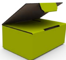
Click Fix II